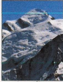
Le mont Blanc