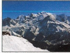
L'aiguille du Midi, le mont Blanc du Tacul, le mont Maudit, le mont Blanc, le dôme et l'aiguille du Gouter, l'aiguille de Bionnassay