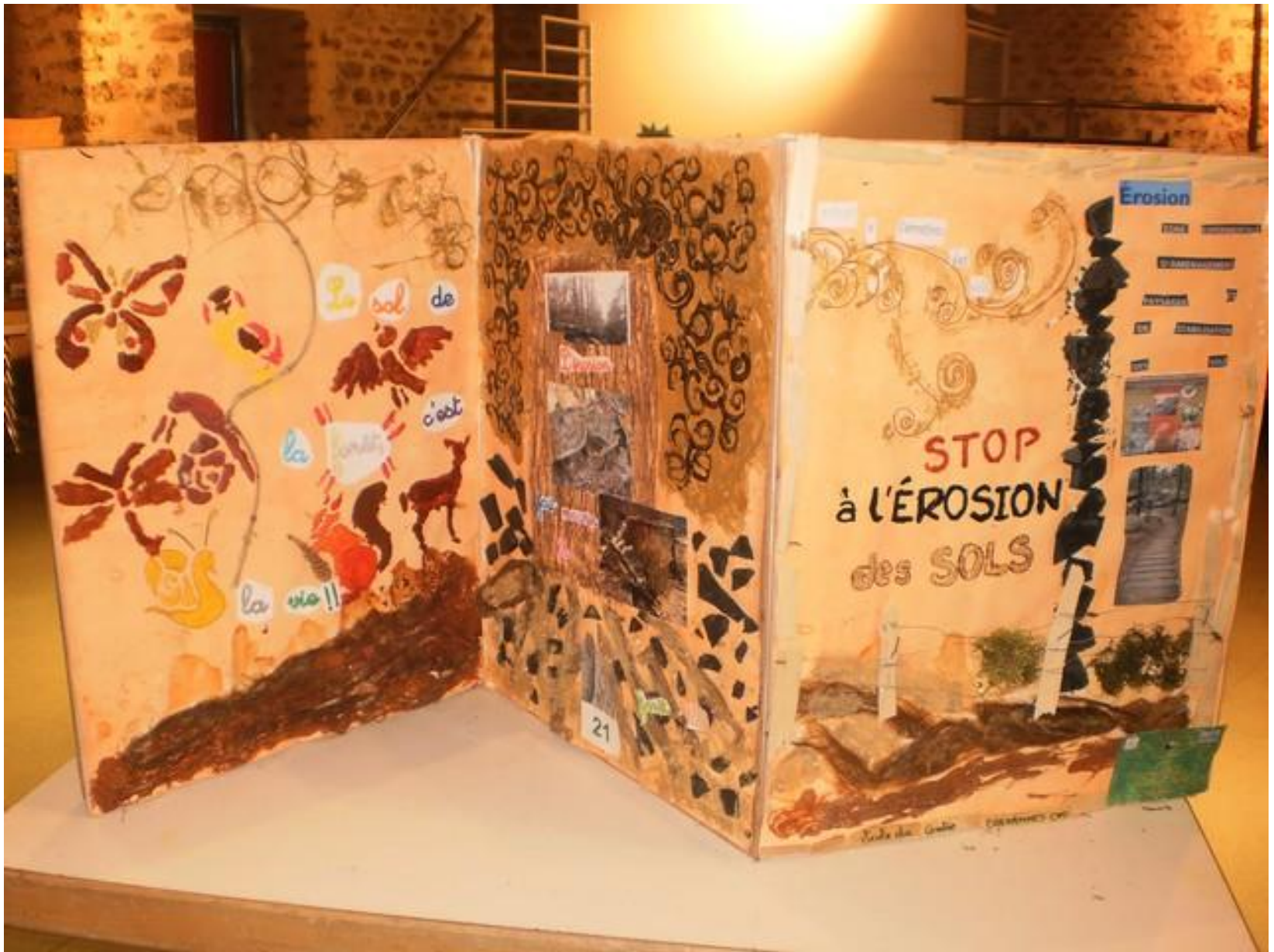
CM1: L'ÉROSION DES SOLS