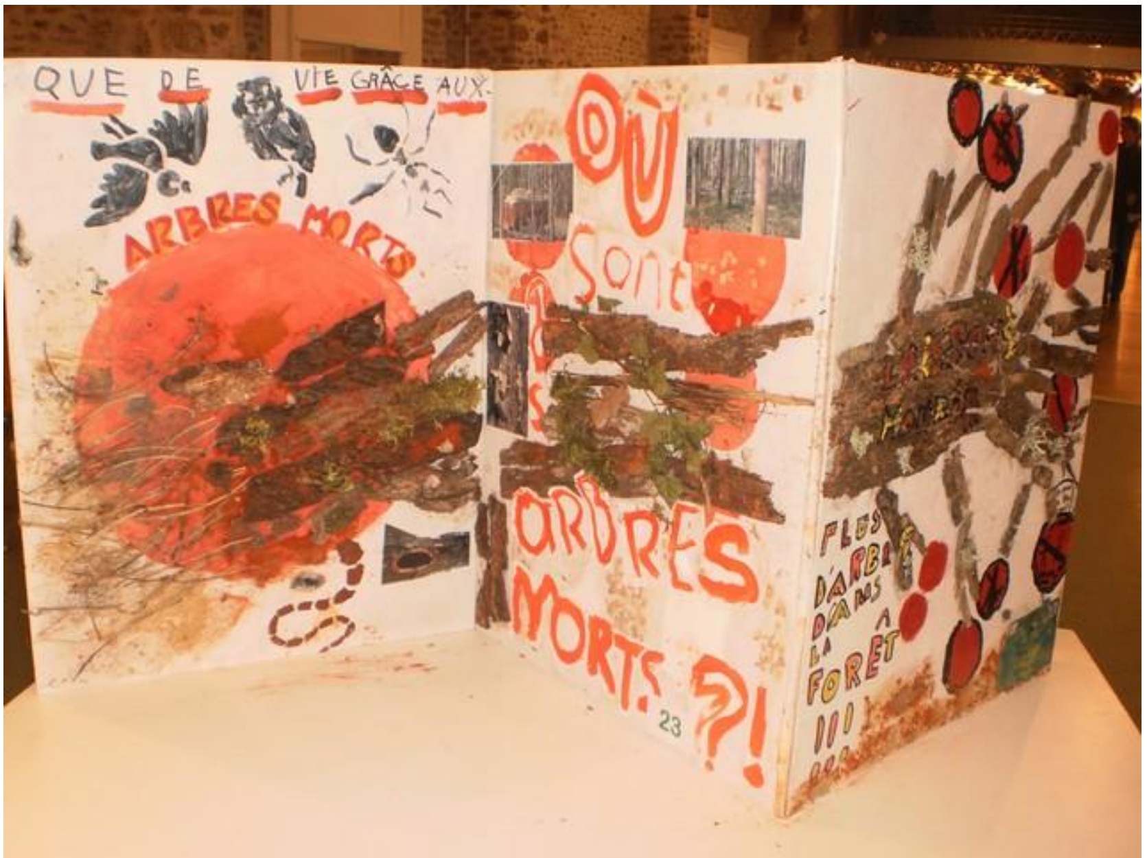
CM1: LES ARBRES MORTS NECESSAIRES A LA VIE