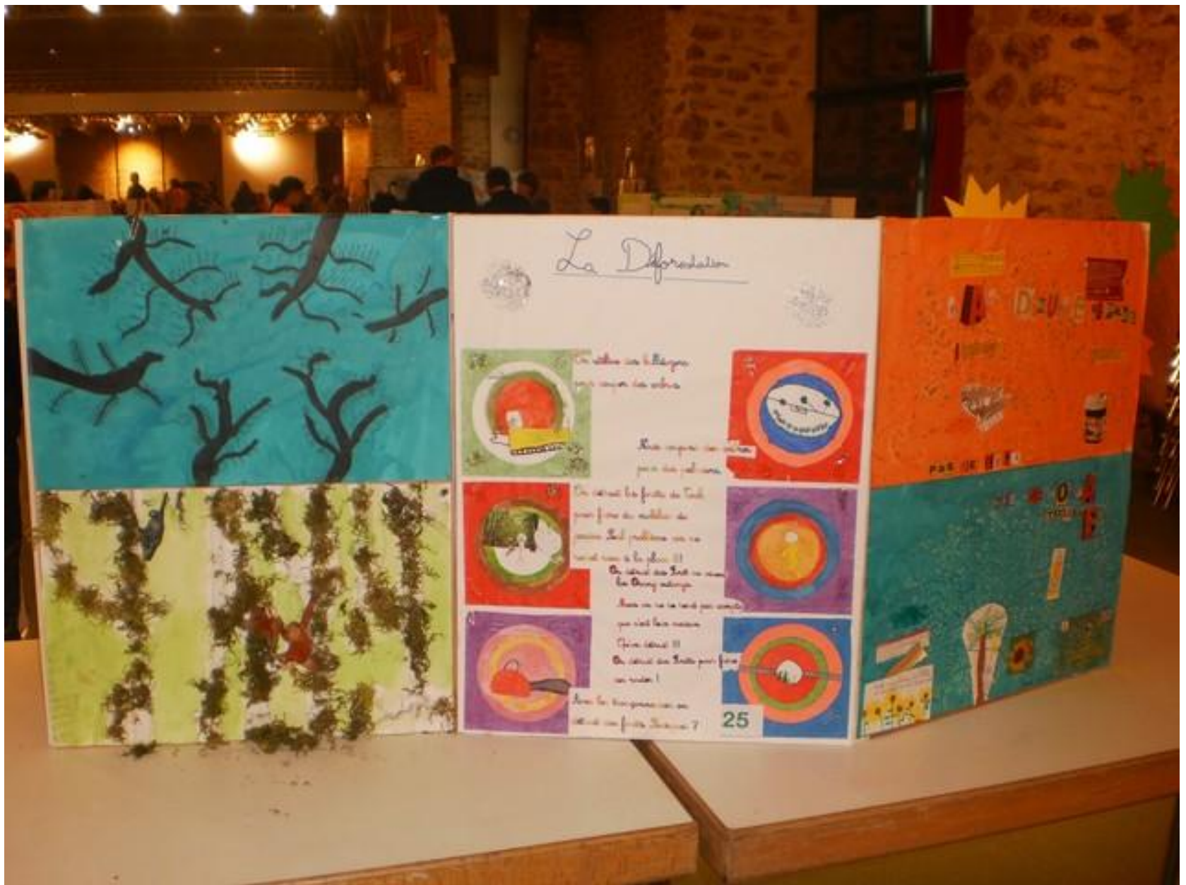
CE2-CM1: LA DEFORESTATION