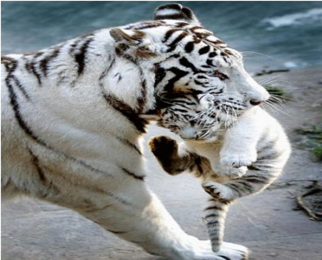
LES TIGRES BLANCS