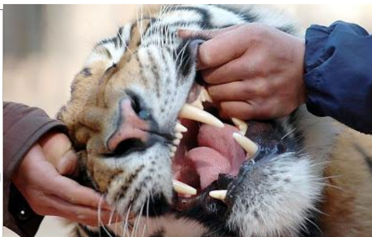
Mâchoire de tigre