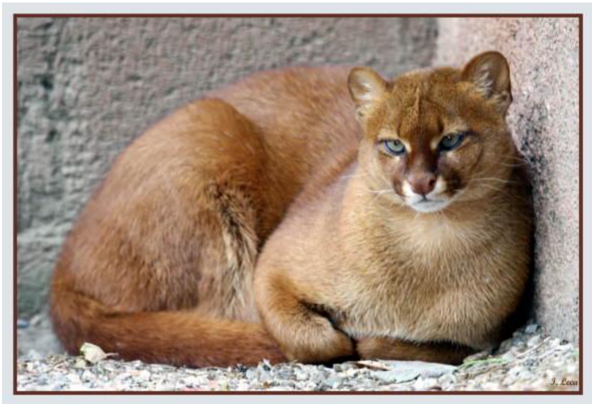
Une femelle jaguarondi

CE GENRE GROUPE LES CHATS DOMESTIQUES ET SAUVAGES , L'OCELOT , LE SERVAL, LE LINX , LE CARCAL , LE JAGUARONDI ET LE PUMA