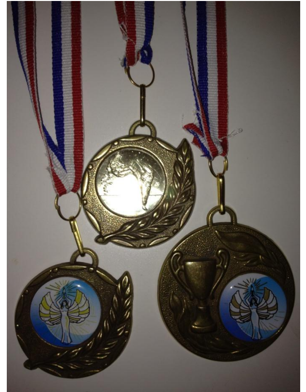
Mes premières médailles !