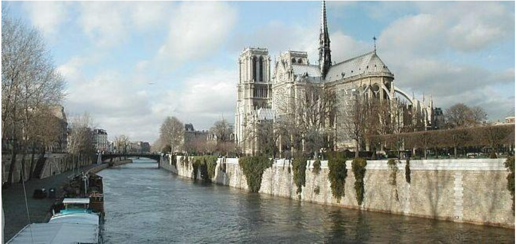
Bâtie sur l'île de la cité, en bordure de Seine à Paris.