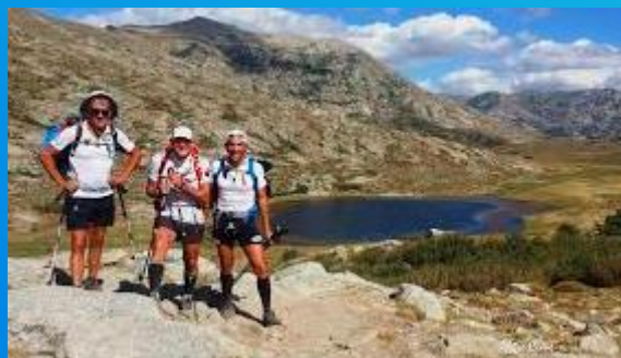
Randonnée le G2o