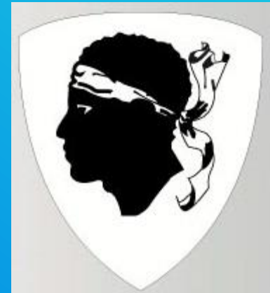
Blason de la Corse

La Corse a été rattachée à la France, par le Traité de Versailles du 15 Mai 1768 par lequel la République de Gènes cédait aux Français ses droits sur l'île. La Corse étant contre cet accord puisqu'elle était indépendante depuis 1730. Elle est réellement conquise par les armes peu de temps après.