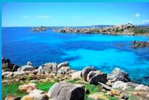
Les îles Lavezzi