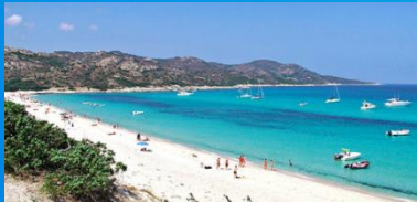
Plage de Saleccia