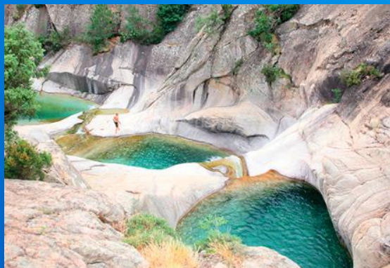
Piscine Naturelle Baignade Sauvage