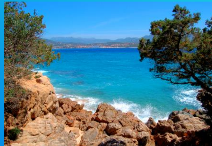
La baie de Propriano

La Corse abrite aussi une multitude de petites baies