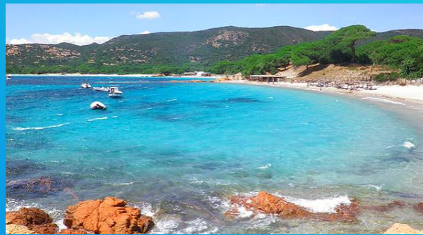
Plage de Palombaggia