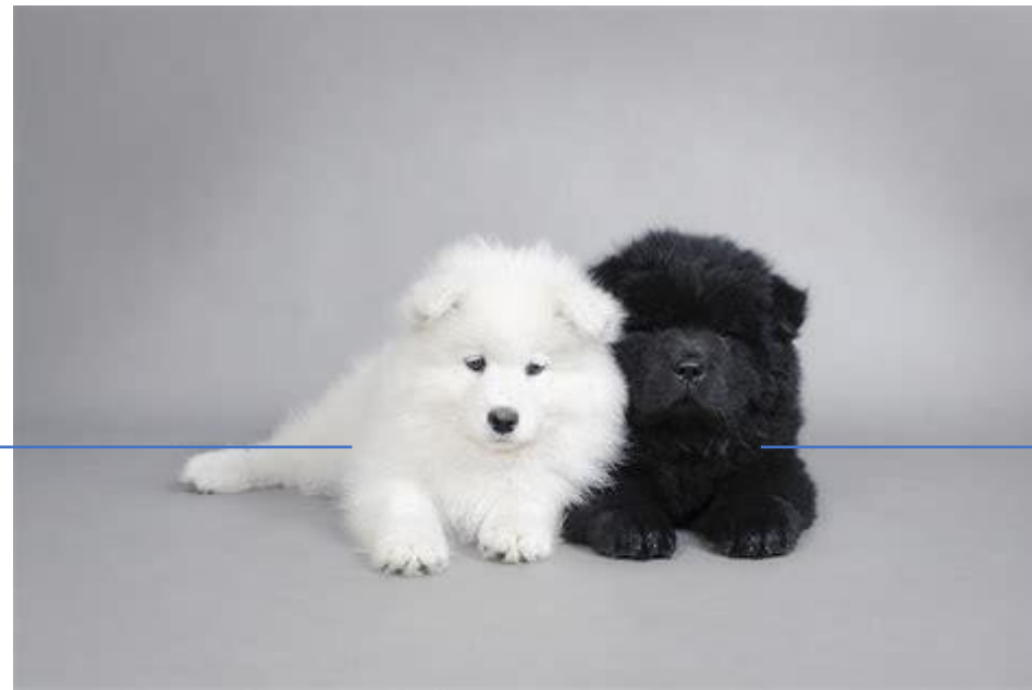
Le samoyède blanc

Avec l'évolution de cette race vers le blanc, les possibilités variation pour les couleurs de la robe se sont restreintes. Aujourd'hui, la robe du Samoyède oscille entre le blanc immaculé, le blanc et la couleur biscuit. On reste dans les tons les plus clairs ! Il existe des samoyèdes noirs mais ils sont des croisés.