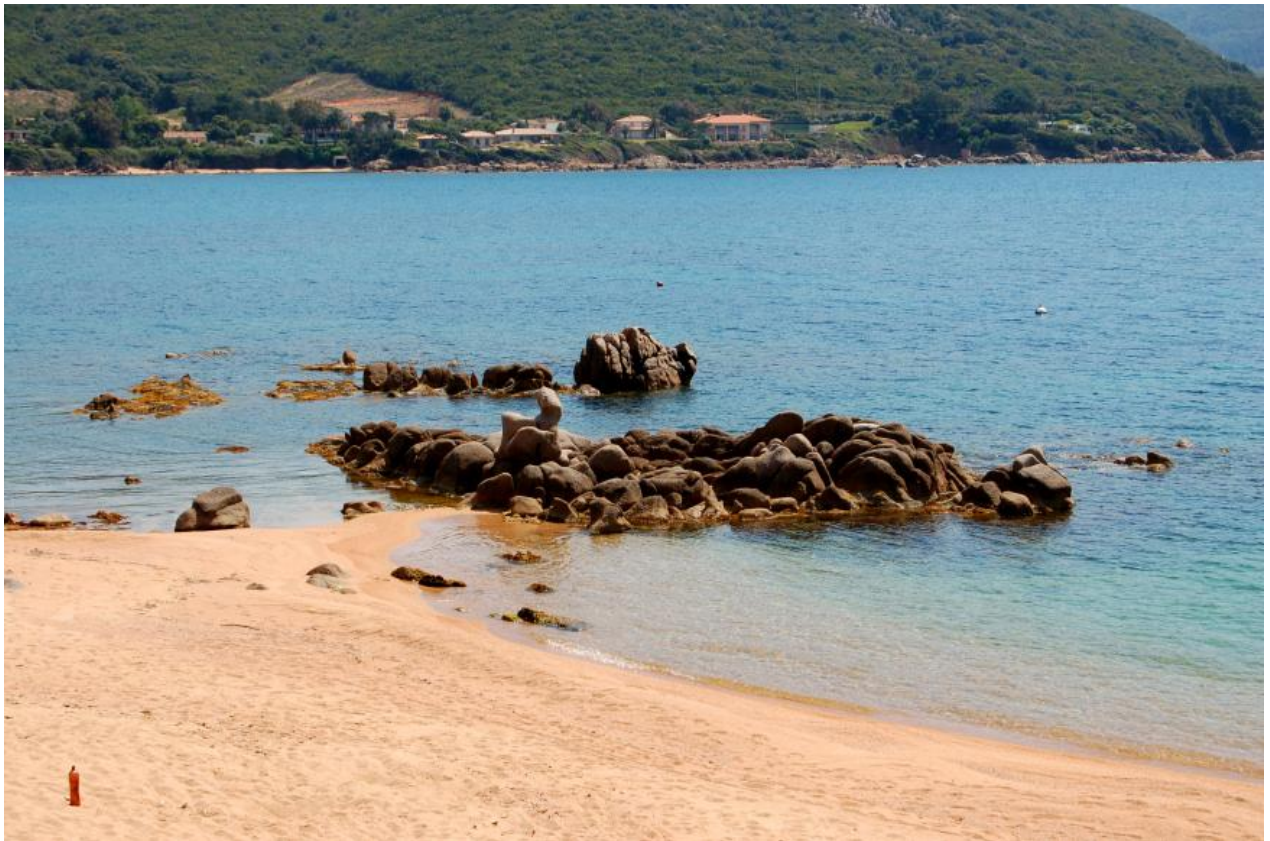
La plage d'Isollella