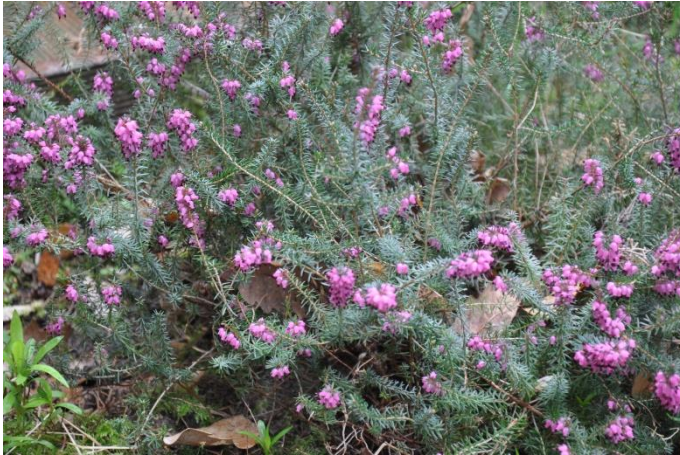
La bruyère (fleurs sauvages)