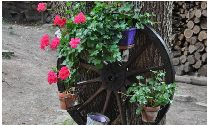
Le geranium (représente le bonheur)