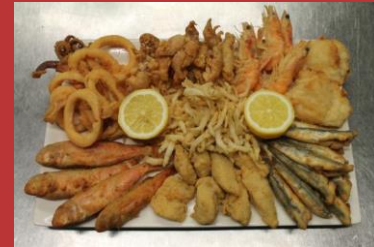
les poissons frits