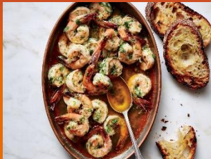
Gambas al ajillo