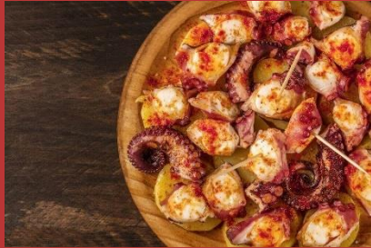
Poulpes à la galicienne