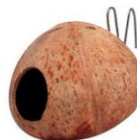
une branche évidée ou une noix de coco coupée