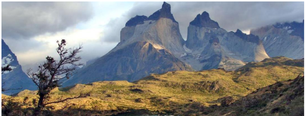
Centre du Chili :

L'habitat de l'octodon comprend essentiellement des pentes rocheuses dont la végétation est rare, on y trouve juste quelques buissons. Dans les montagnes, l'octodon se trouve à environ 1 200 m d'altitude, mais jamais à 2 000 m car il ne supporte pas les températures trop élevés. Il s'abrite dans des galeries profondes d'environ 2 m pour vivre à une température constante.