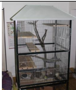
un parcours fait de tablettes, passerelles, tubes...