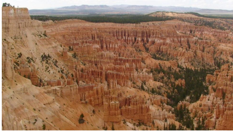
Montagnes du Nord :

L'octodon vit dans les montagnes du Nord et du centre du Chili, en Amérique.