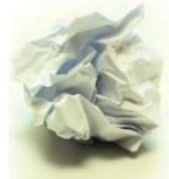
une boule de papier