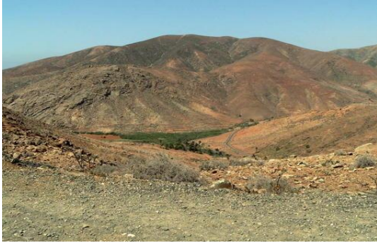
Ca c'est le volcan de Fuerteventura