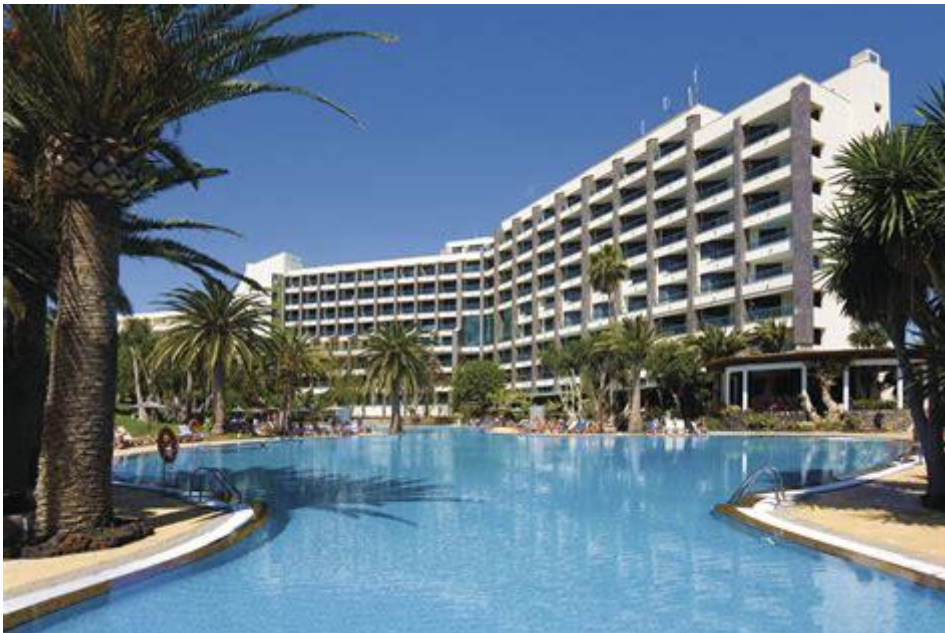
voici l'hôtel où j'ai dormi, c'est le MELIA Goriones