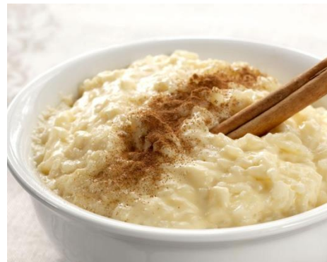
Arroz doce (Riz au lait)