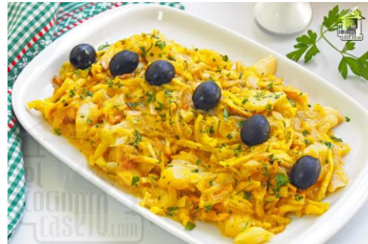
Bacalhau à bras (Morue avec des frites)

Les desserts et pâtisseries sont à base de crème parfumée à la fleur d'orange.