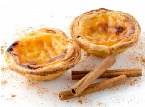
Pasteis de nata (Flan à la crème)

Les desserts et pâtisseries sont à base de crème parfumée à la fleur d'orange.