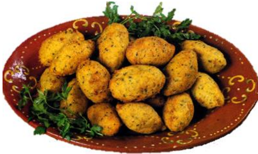
Bolos de Bacalhau (Accras de morue)

La cuisine portugaise est surtout à base de poisson, plus particulièrement la morue (en portugais : bacalhau) qu'ils mangent séchée ou salée ou en bouillabaisse, souvent avec des œufs et des olives. Impossible d'aller au Portugal sans y goûter ! Ils aiment également les soupes de légumes ou de poissons (en portugais : sopa)