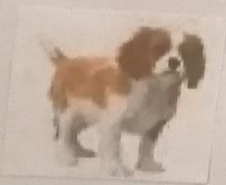
Cavalier King Charles