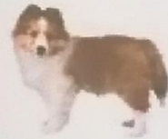
Berger des Shetland